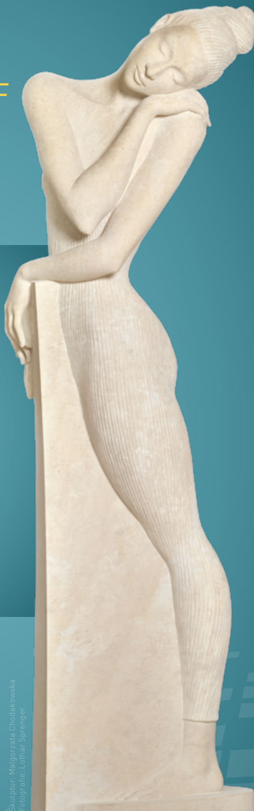
Skulptur: Małgorzata Chodakowska

Gerd Sperhackle | Eigenmessen Tel.: 0351 4458 - 113 Fax: 0351 4458 - 148 gerd.sperhackle@messe-dresden.de